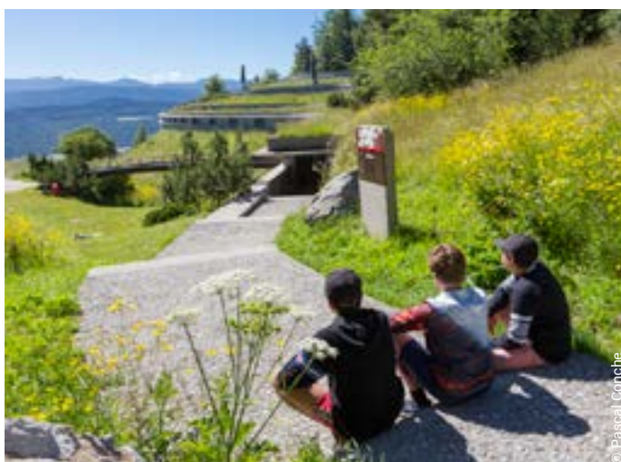
Mémorial de la Résistance