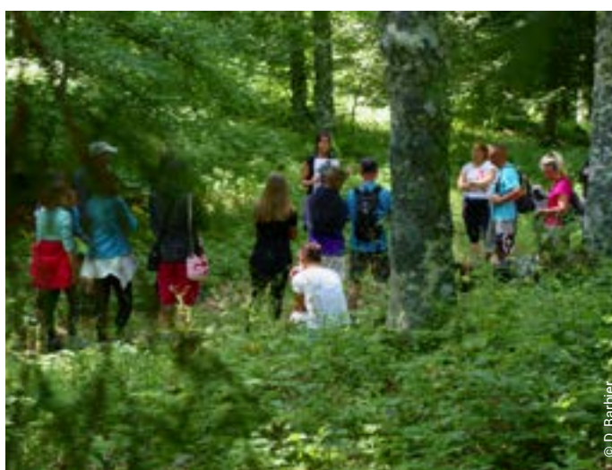
Sur les pas des Maquisards – Mémorial Hors les murs

SUR LES PAS DES MAQUISARDS | Balade commentée au camp de maquisards n° 6