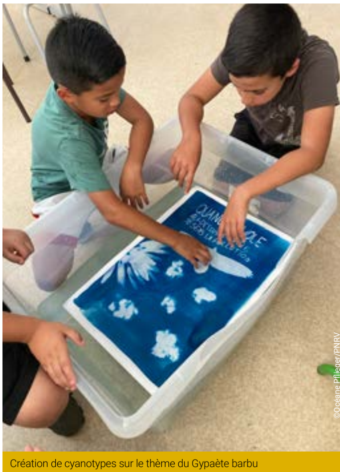
Création de cyanotypes sur le thème du Gypaète barbu

RÉSUMÉ | Le Gypaète barbu avait complètement disparu du Vercors et de l'arc Alpin depuis la fin du XIX e siècle. Le dernier témoignage de sa présence remonte à 1879 dans le Royans. Diabolisé par méconnaissance, on sait aujourd'hui que sa présence est primordiale dans les écosystèmes montagnards. Depuis 2010, 17 oiseaux ont été réintroduits dans le Vercors. Ces années d'engagement sont aujourd'hui récompensées par une présence régulière d'oiseaux dans le sud du massif (Glandasse, Archiane) et la toute première reproduction et naissance en 2022 ! Pourtant, cette espèce reste rare. Elle est toujours classée « menacée de disparition » en France et en Europe.