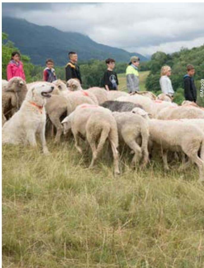
Journée d'immersion en alpage en présence d'un troupeau

Engagement à prendre : participation à la rencontre de lancement du projet le 18 novembre 2026 (après-midi).