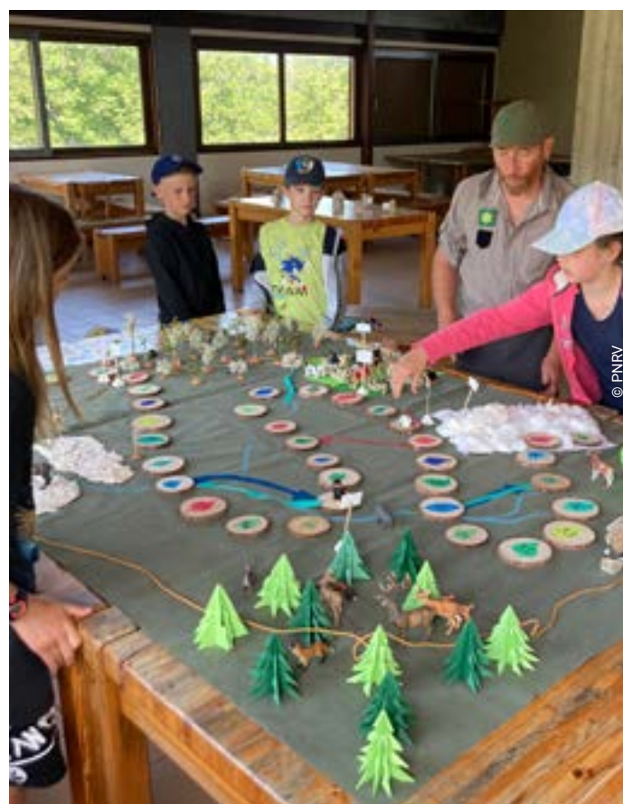
Temps de restitution avec un garde au cœur de la Réserve naturelle

RÉSUMÉ | L'intention de ce projet est de permettre aux élèves de découvrir concrètement ce qu'est une Réserve naturelle et quelles sont les spécificités de cet espace (en quoi la Réserve se différencie du Parc naturel régional du Vercors). L'idée est aussi celle de s'approprier le territoire des Hauts-Plateaux en leur proposant une immersion. Les élèves, mis en situation d'acteurs de leur projet, s'impliqueront concrètement dans des actions en faveur de leur environnement local. Ils partageront leurs découvertes au sein de l'école et lors d'une journée inter-classes.