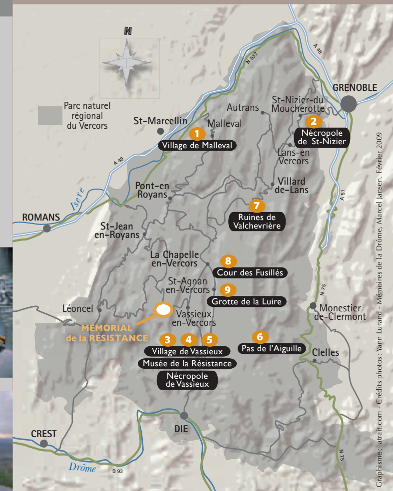
Graphisme : atrait.com - Crédits photos : Yann Lurand - Mémoires de la Drôme, Marcel Jansen, Février 2009

Col de la Chau, 26420 Vassieux-en-Vercors tél : 04 75 48 26 00 fax : 04 75 48 28 67 info@memorial-vercors.fr www.memorial-vercors.fr