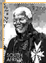
Nelson Mandela s'est battu contre l'apartheid en Afrique-du-Sud.

Le mot « résistance » célèbre un honneur, une dignité retrouvée face à tous les abaissements.