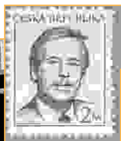
Vaclav Havel s'est battu pour le respect de la démocratie en Tchécoslovaquie.