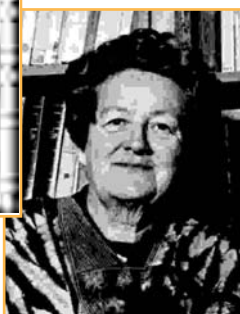
Germaine Tillion se bat pour la défense des libertés fondamentales.