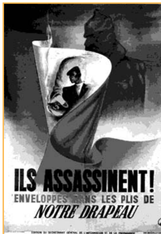
Affiche de propagande anti-alliée de Vichy.