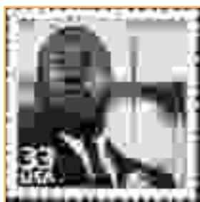
Martin Luther King s'est battu pour les droits des Afro-Américains aux États-Unis.

Jérôme Baschet, historien EHESS, L'étincelle zapatiste. Insurrection indienne et résistance planétaire, Paris, 2002.