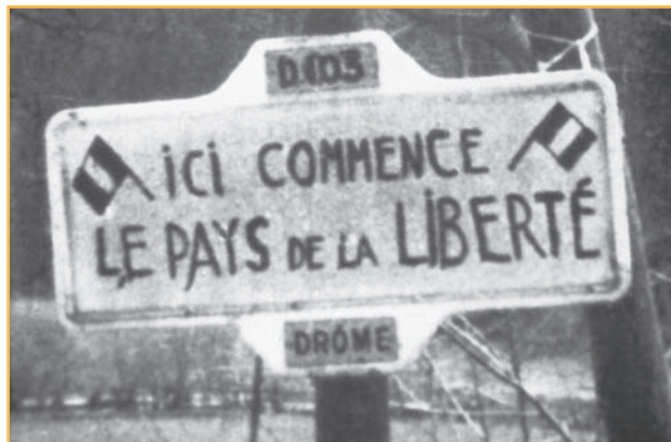
Image extraite du film « Au cœur de l'orage », J.P. Le Chanois, 1948.