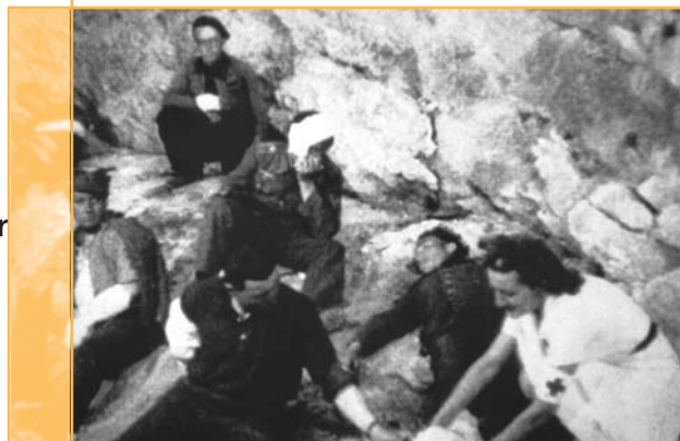
Site National Historique de la Résistance en Vercors

Complainte du partisan , 1943 Emmanuel d'Astier de La Vigerie chanté et popularisé par Léonard Cohen