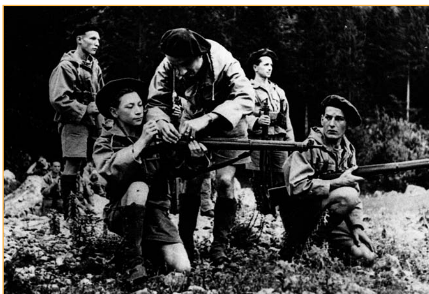
Manuel de 1ère L/ES, Nathan, 2003, p. 322.