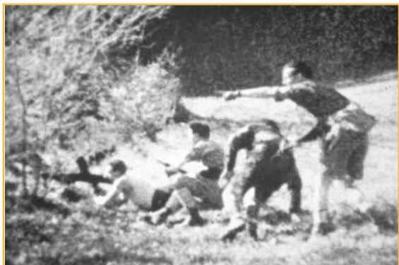
Site National Historique de la Résistance en Vercors