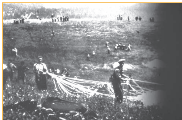
Site National Historique de la Résistance en Vercors