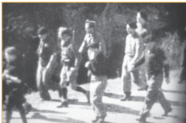
Site National Historique de la Résistance en Vercors

Le 6 juin 1944, à l'heure du débarquement de Normandie, environ quatre cents hommes se trouvent dans le Vercors, mal armés. Le 8 juin, Descour, chef militaire régional, demande à Huet, chargé de commander l'ensemble du dispositif militaire du Vercors, d'appliquer le « bouclage du plateau prévu dans le Plan Montagnards. » L'ordre de mobilisation est lancé, les hommes montent au Vercors.