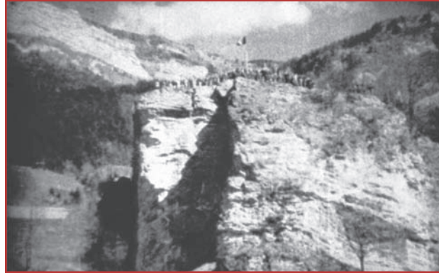
Site National Historique de la Résistance en Vercors

Un véritable mythe s'est constitué autour du plus célèbre maquis de France, conciliant héroïsme et martyre.