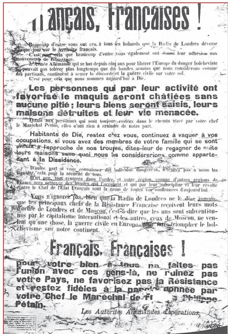
Affiche placardée à Die, fin juillet 1944 (Bulletin Le pionnier du Vercors, octobre 1981).